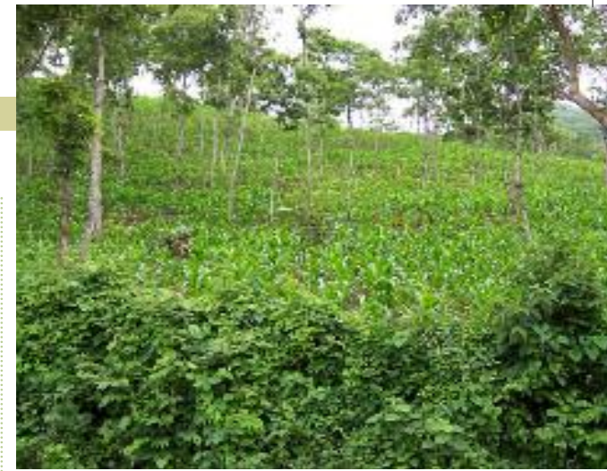
Los cultivos mediante el tradicional método de cultivo agroforestal de los quezungal en Honduras, realizado entre árboles, sin quemar ni explanaciones, que preserva el territorio, la humedad y los hace resistentes a los huracanes.

Aunque cada vez se reconoce en más constituciones su “derecho a la existencia”, Occidente está muy