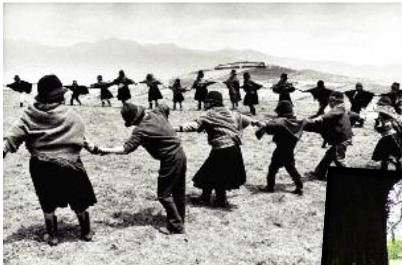
Corro en Ecuador. A la derecha, mujeres mapuches en la celebración de su año nuevo en la Municipalidad de Peñalolén, en Chile. Abajo, ceremonia en torno al tejo de Abamia en Asturias.