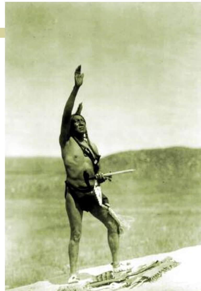
“Invocación”. Foto de un indio dakota de Edward S. Curtis 1907.

Quizá esa humildad del orante indígena que agradece a la tierra sus dones o que pide la lluvia al cielo, o simplemente “envía una voz” o lamento, y cuya oración es la vasija donde recoge el agua de la fuente a la que se acerca sediento, sea la medicina que todos necesitamos, pues sólo el alma que tiene relación con el Espíritu es consciente, por comparación, de sus limitaciones y por su contacto, además, es profundamente transformada. «La más noble de las oraciones es aquella en la que el que reza se transforma interiormente en aquello ante lo que se arrodilla» (Angelus Silesius). Ésa es la consciencia que necesitamos ser, pues es lo que realmente somos y lo que profundamente anhelamos ser, y es la que anuncian todas las